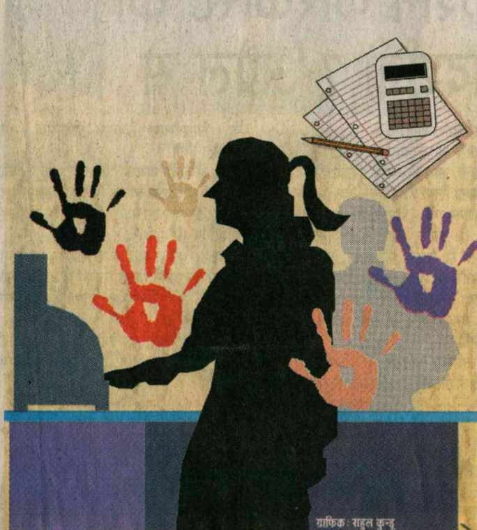
अंतिम चरण में है सेक्सुअल हरेस्पेंट एट वर्कप्लेस बिल-2007, इस बिल में न सिर्फ गवर्नमेंट व प्राइवेट डिपार्टमेंट बल्कि