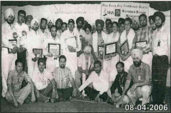
ਸਰਕਾਰੀ ਹਾਈ ਸਕੂਲ, ਬਹਿਬਲ ਖੁਰਦ, ਲਿਟਰੇਰੀ ਕਲੱਬ ਦੇ ਮੈਂਬਰ ਬਾਲ ਸਾਹਿਤ ਮੈਗਜ਼ੀਨਾਂ ਦੇ ਨਾਲ