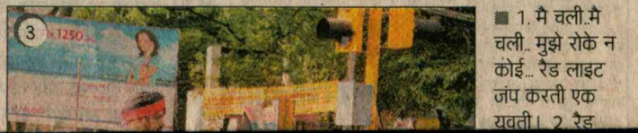
1. मे चली-मे चली... मुझे रोके न कोई... रेड लाइट जंप करती एक यवती। 2. रेड