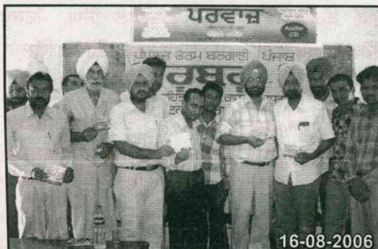
ਪੀਪਲਜ਼ ਫੋਰਮ ਵੱਲੋਂ ਬਰਗਾੜੀ ਵਿਖੇ ਜਲ ਸੇਵਾ ਦੀ ਸ਼ੁਰੂਆਤ ਸਮੇਂ