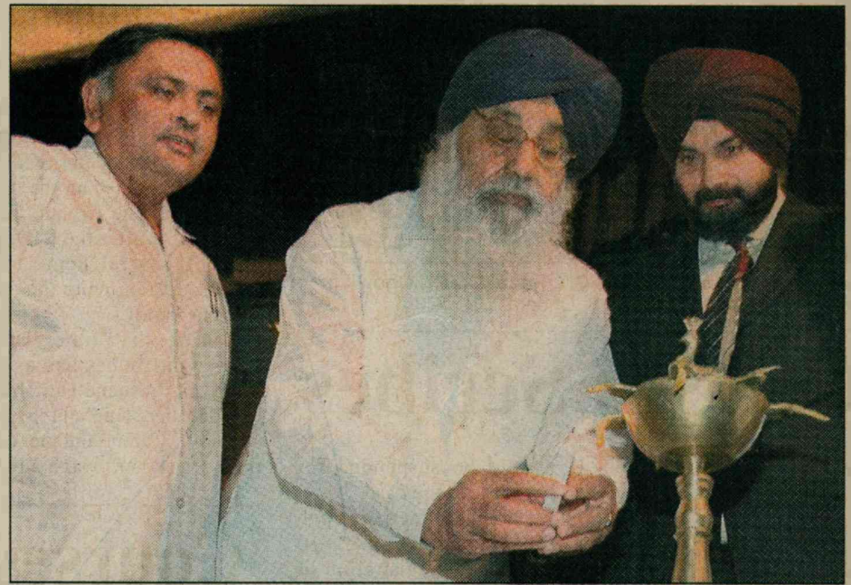
Chief Minister Parkash Singh Badal inaugurates the subsidy distribution function at Guru Nanak Bhawan in Amritsar on Saturday. Industries minister Manoranjan Kalia and BJP MP Navjot Singh Sidhu were also present on the occasion.

The Amritsar Development Authority would plan, execute and oversee all developmental activities in the city while preserving its historic character. Speaking at a session on 'Vision Punjab-2012: Towards Building Amritsar', organised by the Confederation of Indian Industry (CII), Badal also came out with an action