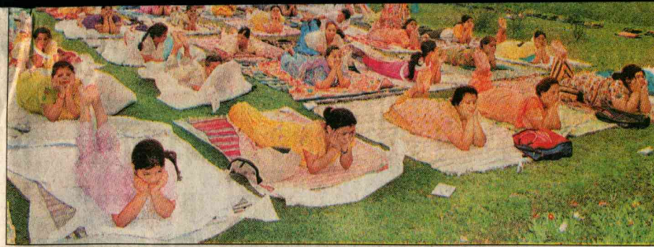
भारतीय योग संस्थान द्वारा कंपनी बाग में आयोजित योग शिविर में भाग लेते योगी।