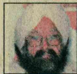
THIS ABOVE ALL KHUSHWANT SINGH

Both believed in the superiority of the Aryan race and approved of Adolf Hitler exterminating millions of Jews in gas chambers. Nevertheless they supported Zionism and Jewish State of Israel for no other reason than it was forever waging wars against its Arab neighbours who were Muslims. Islamophobia became an integral part of Hindutva.