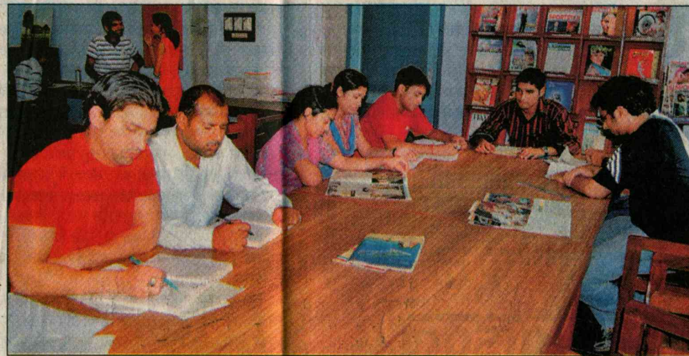
यूनिवर्सिटी के रीडिंग रूम में पढ़ाई-लिखाई का दौर।

एग्जाम्स के कारण स्टूडेंट्स मस्ती छोड़ पढ़ाई में बिजी हैं, जिस कारण हरदम युवाओं से भरा रहने वाला यूनिवर्सिटी कैम्पस बे-रौनक हो गया है। रही सही कसर गर्मी ने निकाल दी है।