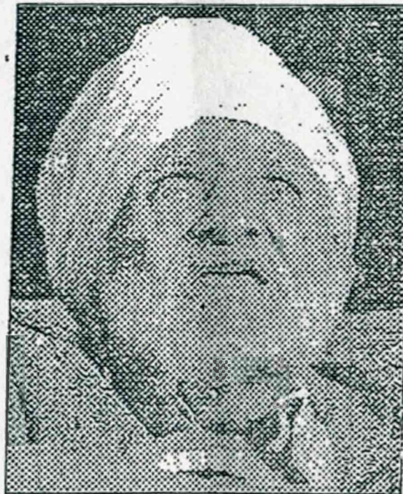
ਬਾਬਾ ਭਗਤ ਸਿੰਘ ਬਿਲਗਾ

ਪ੍ਰਾਪਤ ਜਾਣਕਾਰੀ ਅਨੁਸਾਰ ਦੇਸ਼ ਭਗਤ ਯਾਦਗਾਰ ਕਮੇਟੀ ਦੀ ਕਾਰਜਕਾਰਨੀ ਵੱਲੋਂ ਲੰਘੀ 21 ਅਪਰੈਲ